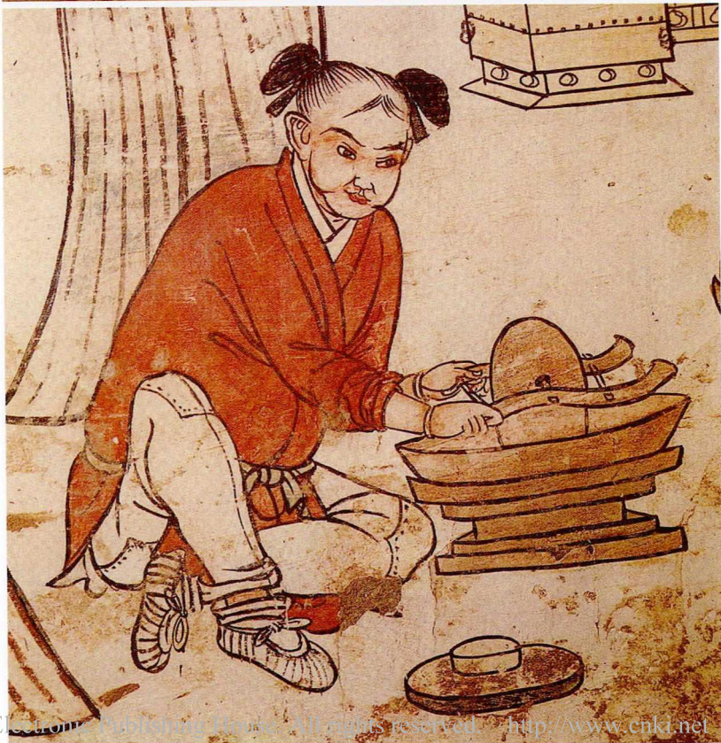
图九 河北宣化辽墓壁画中，右下角的懂仆正在用石碾碾茶叶