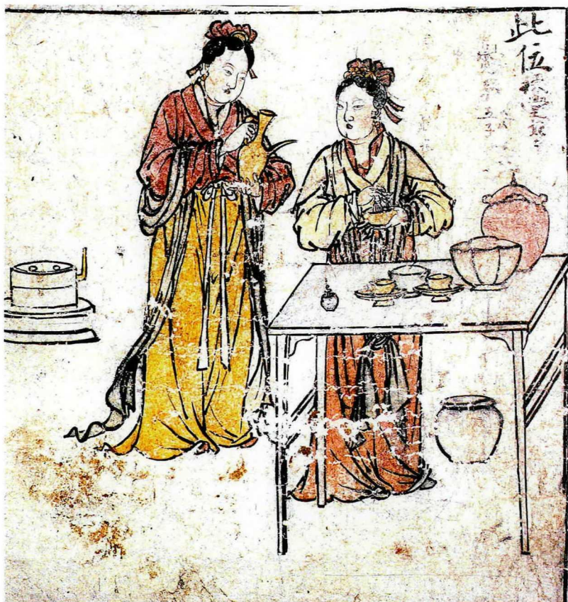
图一二 元代侍女备茶壁画