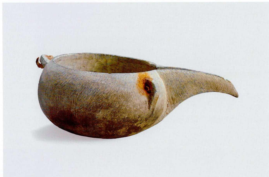
图四 宋 石茶铫 中国茶叶博物馆藏

涩不宜泉，爱此苍然深且宽。蟹眼翻波汤已作，龙头拒火柄犹寒。姜新盐少茶初熟，水渍云蒸藓未干。自古函牛多折足。要知无脚是轻安。”开篇就表达了对石质茶铫的偏好，他认为铜铫煮茶带有腥味，而铁铫又有涩味，都不宜煎水；石铫煮水则最宜泉水的秉性。其次，从诗中可以了解石茶铫的基本造型为有柄、有流、无足、口宽腹深，从“龙头拒火柄犹寒”一句可知周穉送给苏轼的石铫其柄为龙首形，由于横柄比较长，在炉上煎煮时间长也不会太烫手。最后一句“自古