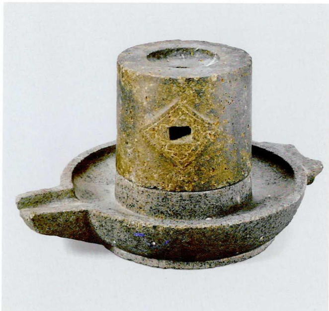
图一〇 宋 石茶磨 新安沉船出水