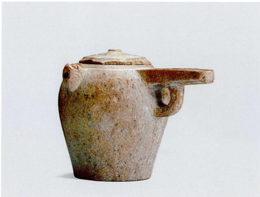
图二 唐 石质龙首横柄壶 中国茶叶博物馆藏

墓出土的壶如出一辙，因史墓明确为天宝三年纪年墓，所以台中自然科学博物院收藏的滑石茶具应该是盛唐时期的产物。值得注意的是，姜捷文中把图片左上方的器物命名为“圆形台座温炉”，细究应是石茶臼，是唐代除了茶碾之外的另一重要研磨器，其用途与茶碾类似。此外，姜捷文中提到的“长方形案台”，应该就是陆羽《茶经》“四之器”中的具列，可与《萧翼赚兰亭图》中煮茶场景相对应。