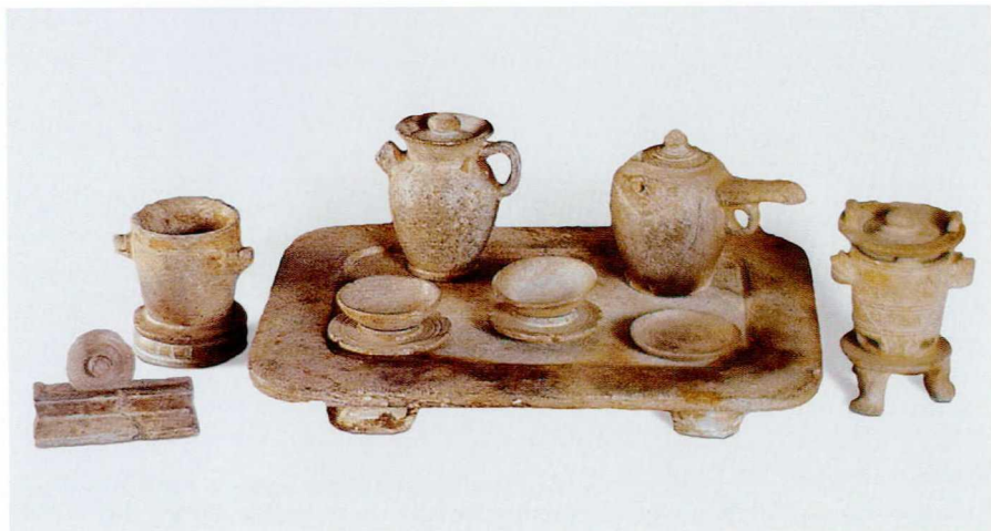
图一 唐滑石茶具组 中国台湾台中自然科学博物院藏

中国人对石头有着近乎痴迷的喜爱，古人赋予石头以灵性之美，认为“天地至精之气，结而为石”，赏石、砚石一直是历代文人士大夫的喜爱之物。有意思的是，唐宋两代也是石茶器使用的黄金时期，从各地出土的文物和历史文献看，唐代和宋、元时期是石质茶器的流行期，明代以后，石茶器的使用才慢慢淡出历史舞台。