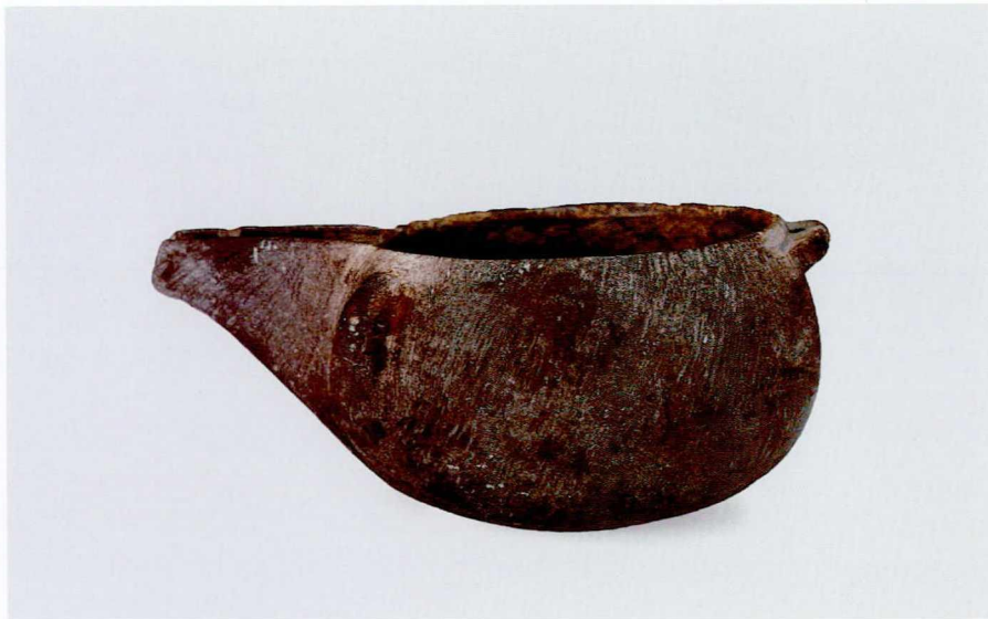
图三 宋 石茶铫 中国茶叶博物馆藏