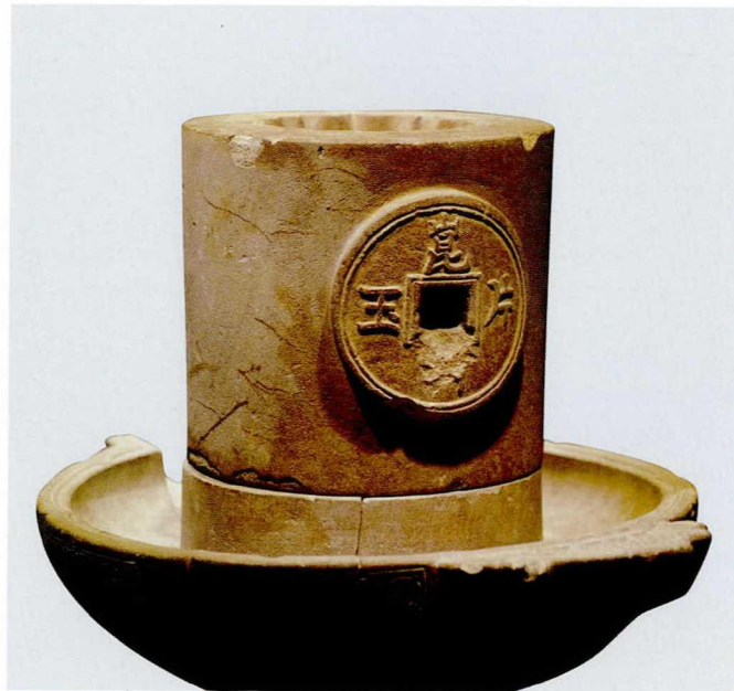
图一一 宋 石茶磨 惠州博物馆藏